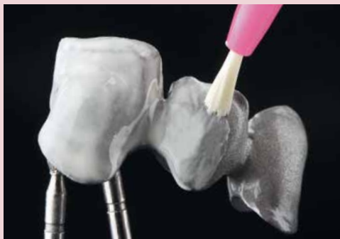
SHOFU Universal Pre-Opaque