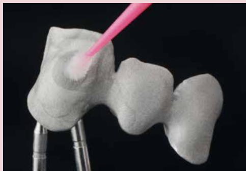
SHOFU MZ Primer Plus