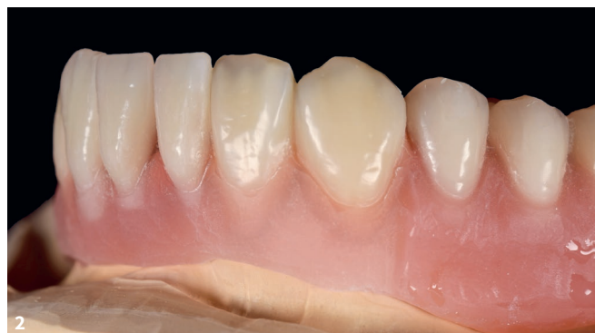
Abb. 1 Die UK-Teleskopprothese nach dem Anlaufenlassen beziehungsweise der Kunststofffertigstellung der Sättel: Die Sekundärteleskope 32, 33, 43, 44 sind mit dem CERAMAGE-System (Fa. Shofu, Ratingen) verblendet, die Zähne 31, 41 und 42 sind mit Konfektionszähnen ersetzt, die neben den Verblendungen monochrom und leblos wirken. Abb. 2 Der rosafarbene Kunststoff wurde im Bereich von 43 bis 33 bereits reduziert, um später Platz für die individuelle Gestaltung der Gingiva zu haben – die vertikale Kante verschwindet später durch das Auffüllen mit Zahnfleischmasse.