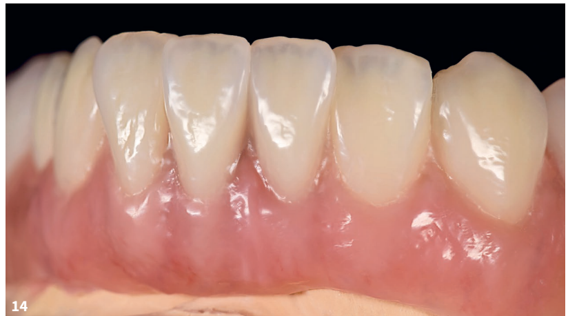
Abb. 13 Was in der Aufstellung der konfektionierten Zähne angedeutet war, kommt nach der Verblendung noch stärker heraus: zum Beispiel die Verschachtelung am Übergang von Zahn 41 zu 42. Abb. 14 Ansicht von linkslateral: Die angedeutet verschachtelte Stellung von Zahn 31 vor 32 wirkt nach der Verblendung „wie gewachsen“.