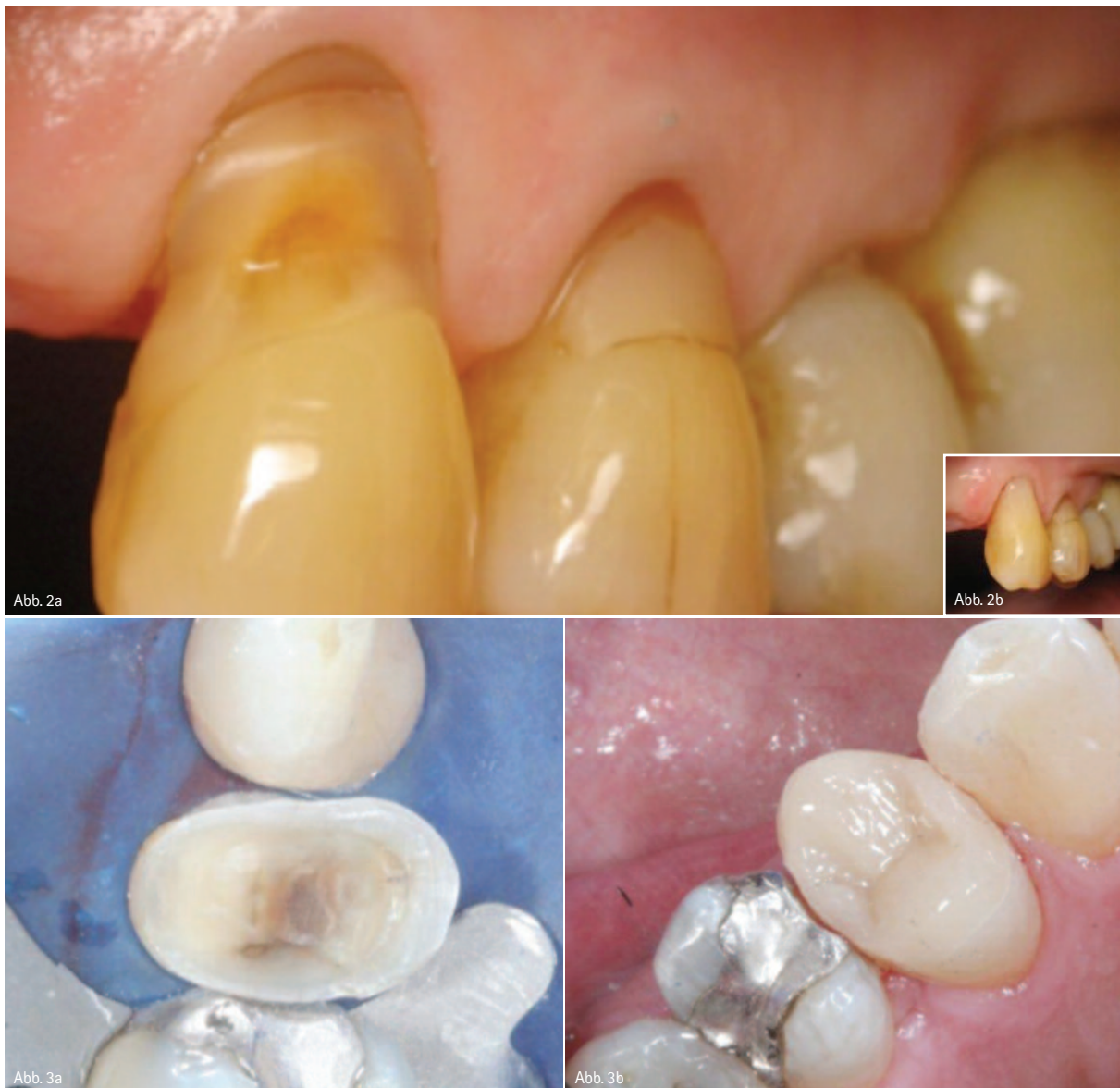
Abb. 2a und 2b: Vorher- und Nachher-Fotos einer Klasse V-Restaurations aus Beautifil Flow Plus F03 an einem oberen rechten Eckzahn. – Abb. 3a und 3b: MOD-Komplettaufbau-Füllung an Zahn 14 mittels Beautifil Flow Plus F00.

nem endgültigen Gesamtdurchschnittspunktwert von 4,2 recht hoch ein. Sehr aufschlussreich bei dieser Bewertung waren auch die Antworten der Praktiker auf die Fragen nach der Einordnung der Wichtigkeit der bei Beautifil Flow Plus vorliegenden Material- und Handlingeigenschaften. In einem Ranking von 1 bis 10 (1 = am wichtigsten, 10 = am unwichtigsten) ergab sich gemäß den gemachten Angaben folgende Einschätzung (s. Tabelle linke Seite).