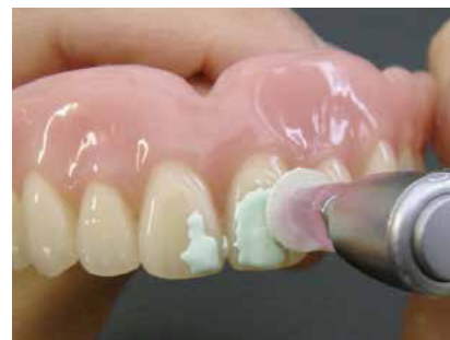
Durch grüne Einfärbung leicht zu erkennen