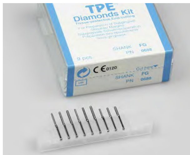
TPE Diamonds Kit contiene nove punte diamantate selezionate.

Sostanza dura del dente: preparazione a spalla