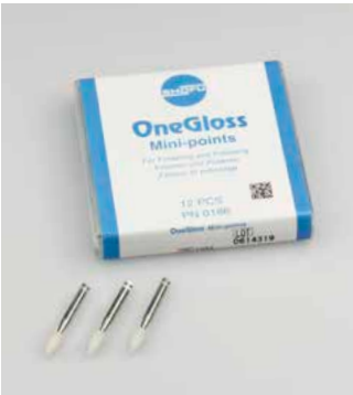
Form: Minispitze Bestell-Nr. 0186

mit Winkelstück-Schaft, 12 St. pro Packung