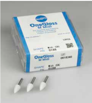
Form: Midispitze Bestell-Nr. 0188