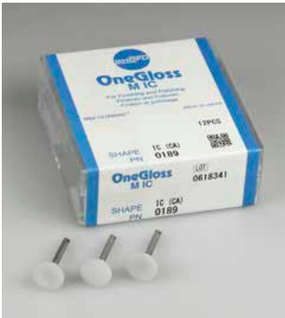
Form: IC Bestell-Nr. 0189