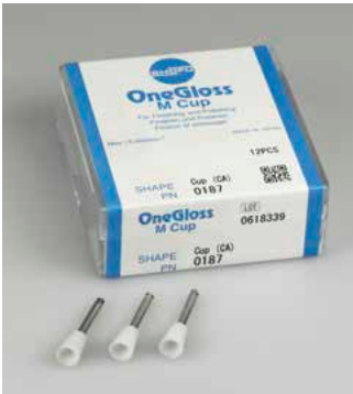
Form: Kelch Bestell-Nr. 0187