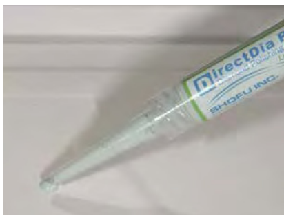
Una cantidad mínima para un diente

La pasta DirectDia contiene hasta un 20 % de partículas de diamante con un tamaño de grano de 2-4 \mu\text{m} . En poco tiempo se consigue un alto brillo perfecto en el esmalte dental natural y en todos los materiales de restauración (cerámica, composites de revestimiento y de relleno, metales, etc.). La pasta tiene un agradable sabor a lima y es fácil de detectar en la boca de los pacientes gracias a su ligero color verde.