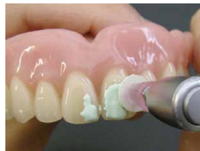
Ligero color verde para una fácil detección