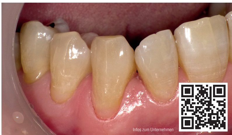
Abb. 13: Direkt nach der Behandlung aller drei Zähne – Die zervikalen Bereiche der Zähne 22, 23 und 24 sind restauriert. Dank der geringen Fließfähigkeit von F03 gelingen solche Füllungen problemlos.

im direkt anliegenden Füllungsumfeld. Durch die Freisetzung von Fluorid und weiteren bioaktiven Ionen werden Karies- und Plaquebildung gehemmt, zudem wird die Säurebildung abgepuffert. Die gezielte Applikation und Dosierung ermöglichen die Gestaltung von dünn auslaufenden Übergängen, die kein mechanisches Reizpotenzial für das Parodontium bieten. Die nachfolgende Überschussentfernung beschränkt sich auf ein Minimum.