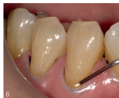
Abb. 5: Lichthärtung – Für eine korrekte Polymerisation wird die Lampe möglichst nahe an die Kavität gehalten. Die vom Adhäsivhersteller angegebene Polymerisationszeit muss eingehalten werden. Abb. 6: Applikation von Beautifil Flow Plus X F03 – Dazu wird die Applikatorspitze nahe an den Schmelzrand gehalten. Die Paste wird nur am inzisal Kavitätenrand appliziert und sollte nicht in den zervikalen Bereich ausgebreitet werden.