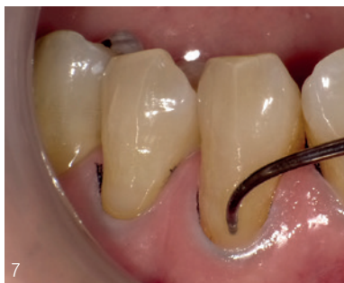
Abb. 7: Unterstützt durch seine geringe Fließfähigkeit unter Schwerkraft wird F03 langsam mit einer Sonde nach zervikal bewegt. Abb. 8: Die Kontur wird mit der Sonde angepasst. Die Paste sollte dabei nicht mit der Gingiva in Berührung kommen.