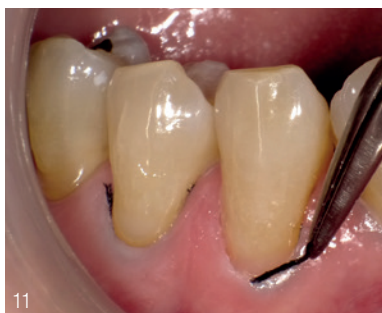
Abb. 11: Überschüsse von Adhäsiv und Komposit sind am gingivalen Rand sichtbar. Abb. 12: Mit einem superfeinen Diamantinstrument (SF416) werden Überschüsse aus dem zervikalen Bereich entfernt. Dann wird die labiale Kontur angepasst.