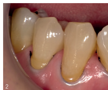
Abb. 1: Präoperativ – Keilförmige Defekte bei den Zähnen 22, 23 und 24. In den Sulkus wird ein Retraktionsfaden gelegt. Abb. 2: Der Retraktionsfaden (SU Pack Cord 000) ist platziert. Durch die Gingivaretraktion bei Zahnfleischfüllungen wird eine ungenügende Haftung der Füllung am gingivalen Rand bzw. eine ungenügende Füllung der Kavität vermieden.