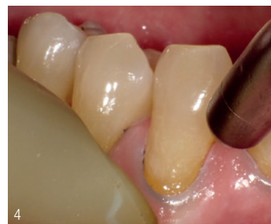
Abb. 3: Auftragen des Adhäsivs (BeautiBond Multi). Abb. 4: Lufttrocknung – Bei einem Ein-Flaschen-Adhäsiv muss das Lösungsmittel verblasen werden. Es wird ausreichend getrocknet und dabei durch Absaugung verhindert, dass das Adhäsiv in den Mundraum spritzt.