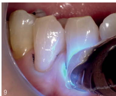
Abb. 9: Lichthärtung – Wie beim Adhäsiv wird die Lampe möglichst nahe an das Material gehalten. Abb. 10: Der Retraktionsfaden wird entfernt.