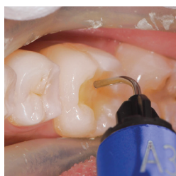
Kavitätenlining mit F03