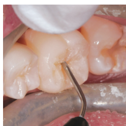
Aufbau der Höckergrate mit F00