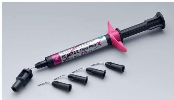
F00 – absolut standfest (Zero Flow)