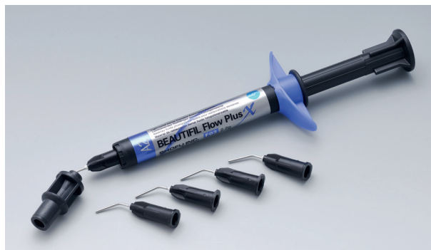
F03 – moderat fließfähig (Low Flow)