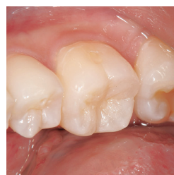
Okklusale Morphologie nach der Füllung