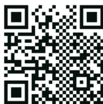
QR-код для сохранения в качестве пользовательского режима

Сканируйте приведенный ниже QR-код, чтобы сохранить режим перекрестной поляризации в качестве пользовательского. Когда появится сообщение „Select the number“ (выбрать регистр), выберите одну из трех пользовательских настроек. Убедитесь, что камера при этом находится в режиме съемки (один из 9 предустановленных режимов), так как в пользовательском режиме невозможно сканировать QR-код.