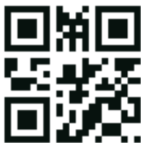
QR-код для активации режима перекрестной поляризации

Отсканируйте QR-код ниже, чтобы активировать режим перекрестной поляризации. Если появится сообщение „Change the optional setting?“ (Изменить дополнительную настройку?), нажмите „ОК“.